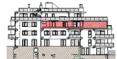
Ostfassade - Richtung Kloostergarten