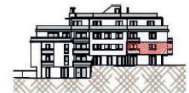
Westfassade - Richtung Ghelelgasse