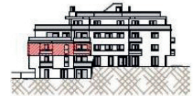
Westfassade - Richtung Ghelegasse