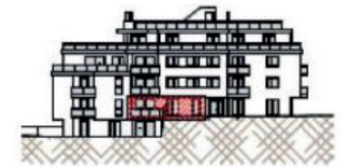
Westfassade - Richtung Ghelengasse