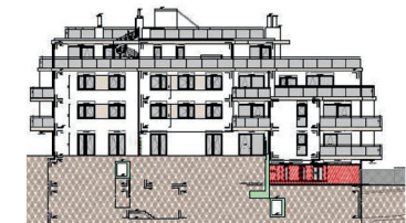
Ostfassade - Richtung Klostergarten