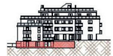
Westfassade - Richtung Ghelelgasse